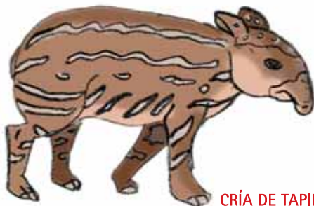
CRÍA DE TAPIR