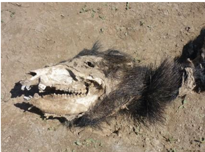
Restos de Maján o Pecarí Labiado ( Tayassu pecari ), sus huellas son muy frecuentes en las costas del río Bermejo.