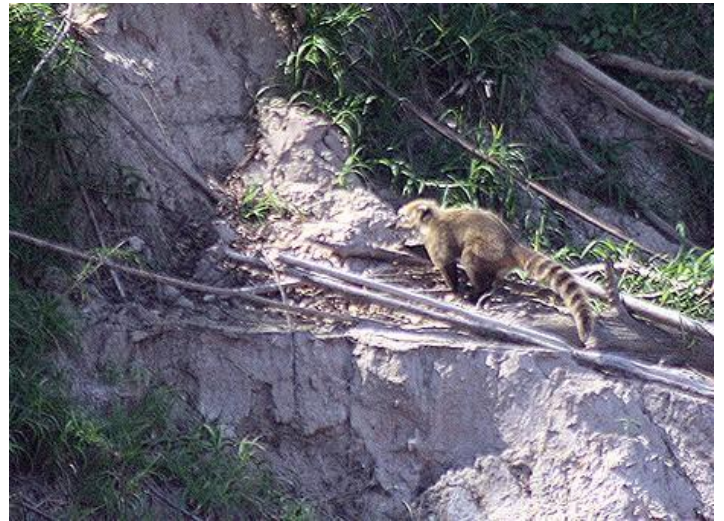
Coatí ( Nasua nasua ) solitario, subiendo un barranco de la costa. Observado en distintas oportunidades tomando agua del río Bermejo.