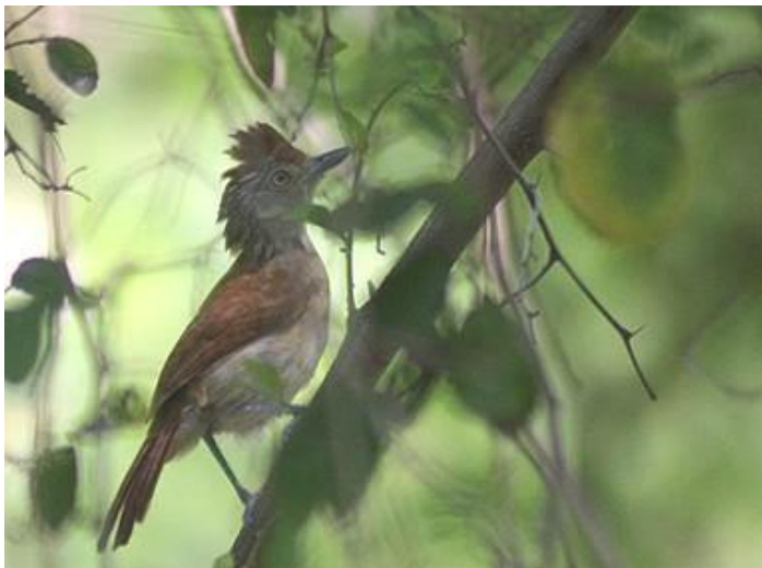
Hembra de Choca Listada ( Thamnophilus doliatus ), especie de hábitos ocultos y difícil de ver, puebla los bosques y sabanas del norte argentino.