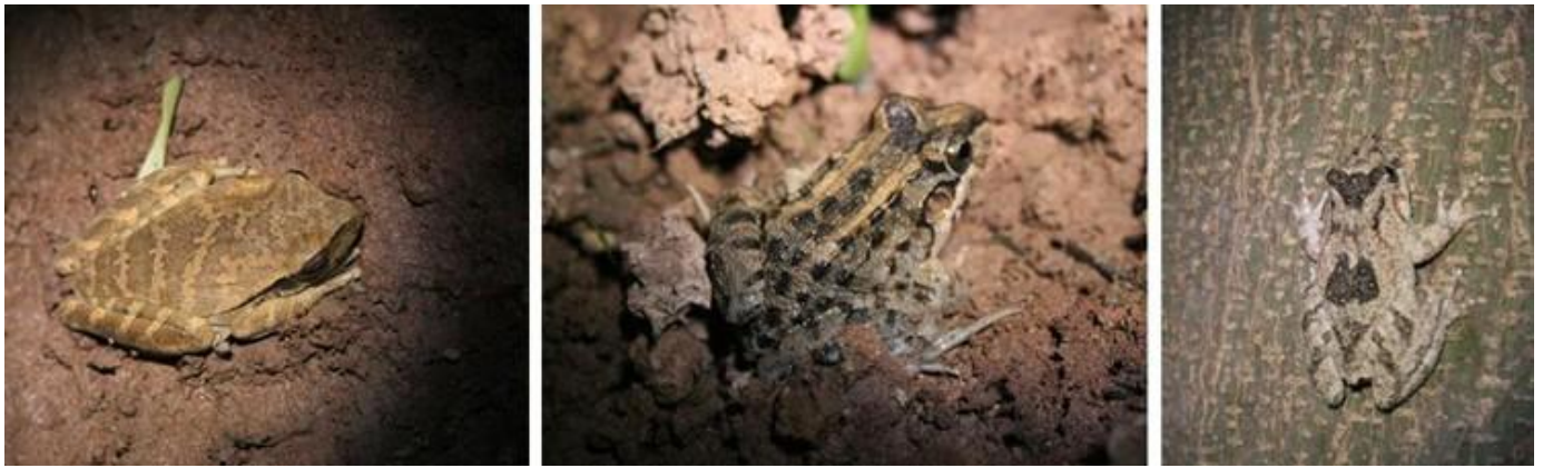
Varias especies de anfibios registradas. A la izquierda: Hypsiboas sp., al centro: Leptodactylus sp. y a la derecha: Scinax sp.).