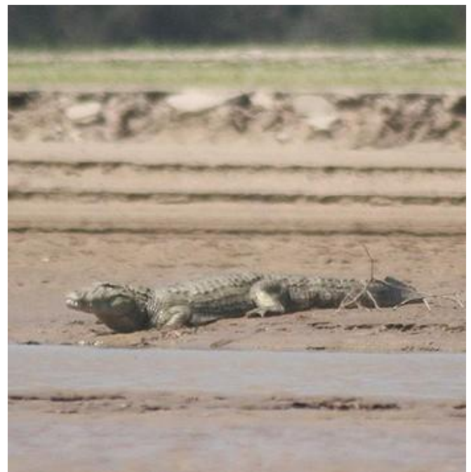
Un Yacaré Overo ( Caiman latirostris ) asoleándose a la orilla del Río Bermejo.