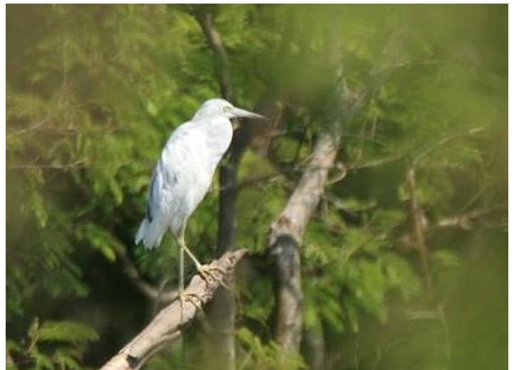
La Garza Azul ( Egretta caerulea ), en el primer registro para la provincia del Chaco. Observada sobre vegetación palustre en lagunas cercanas al Río Bermejito.