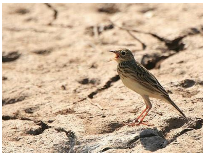
La Cachirla Chica ( Anthus chii ) es difícil de diferenciar de las otras cachirlas, salvo por su canto característico que suena como “tic... tic... yiiiiiii...”.