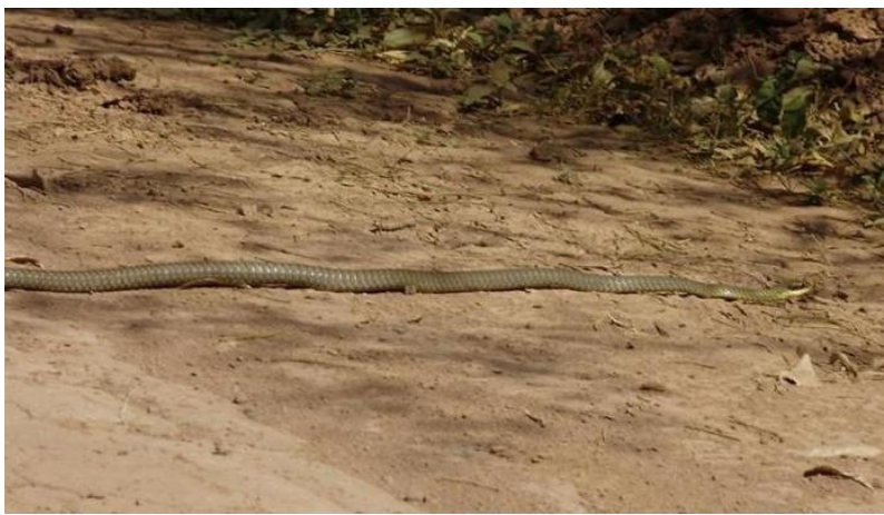
La culebra Chicote o Mboi Hoví ( Chironius quadricarinatus maculoventris ), de hábitos terrestres y arborícolas, se alimenta de anfibios.