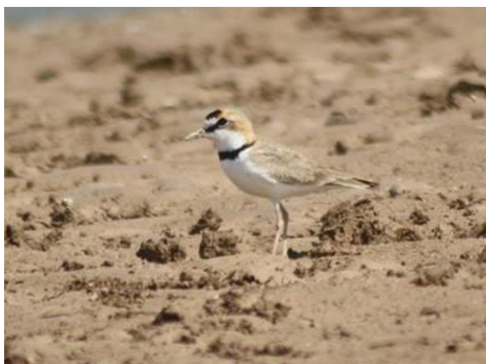
Chorlito de Collar ( Charadrius collaris ), de hábitos acuáticos, es muy común de observar a lo largo del río, se lo ha visto en actividad tanto diurna como nocturna.