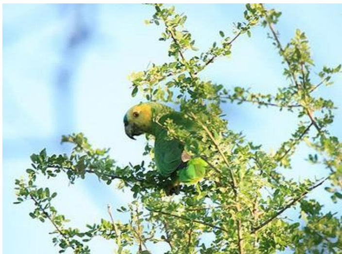
El Loro Hablador ( Amazona aestiva ) busca para nidificar huecos en árboles de gran porte, prefiriendo individuos maduros de quebracho blanco ( Aspidosperma quebracho-blanco ) y de quebracho colorado ( Schinopsis spp.) (Foto: Patricio Coper Cowles).