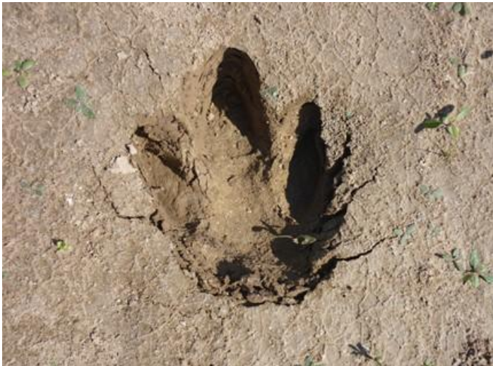
Huella de Tapir ( Tapirus terrestris ). De hábitos principalmente nocturnos, este gran mamífero deja signos de su paso que se aprecian por la gran cantidad de huellas dispersas en las márgenes del río.