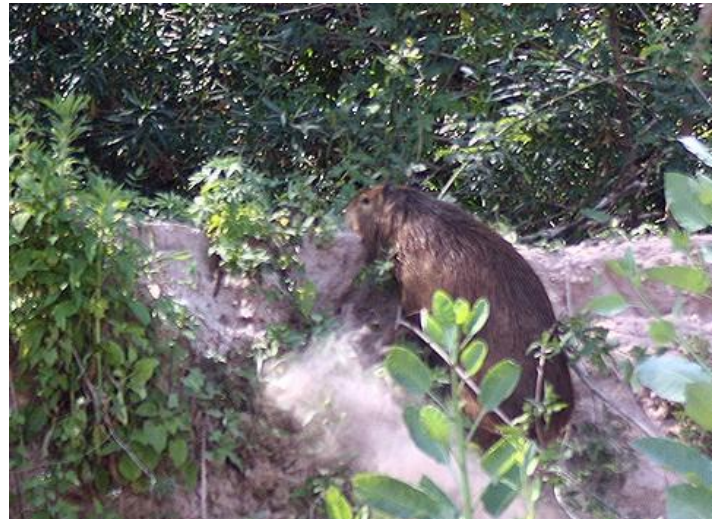
Carpincho ( Hydrochoerus hydrochaeris ) en la costa del río Bermejo. (Foto: Gisela Müller).