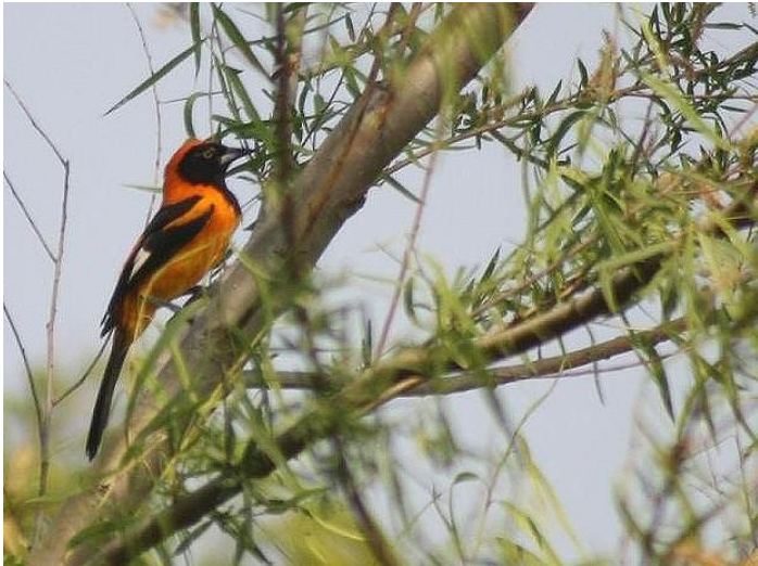
El Matico ( Icterus croconotus ). Contrastante con el paisaje chaqueño por la vistosa coloración de su plumaje y melodioso canto.