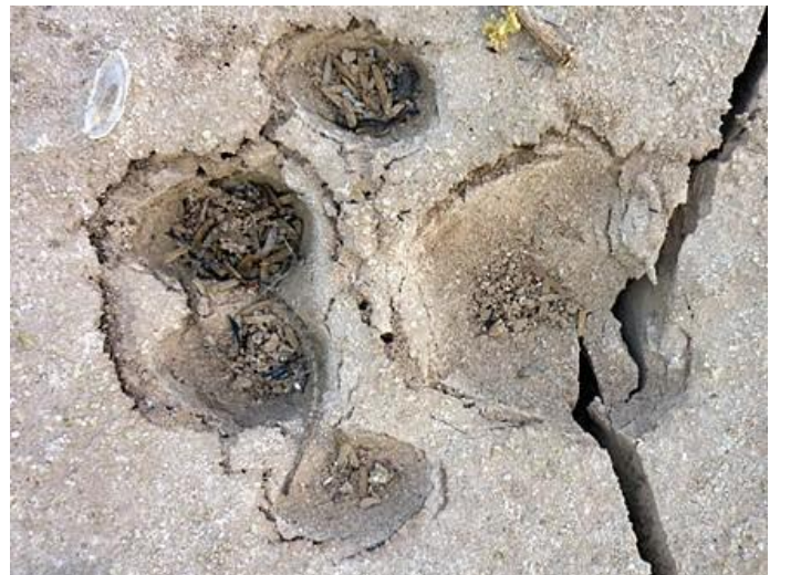
Huella de Puma ( Puma concolor ) en la playa del río Bermejo.