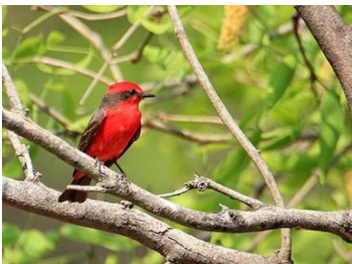
El macho del Churrinche ( Pyrocephalus rubinus ) es inconfundible por la combinación roja y negruzca de su plumaje (Foto: Patricio Coper Cowles).