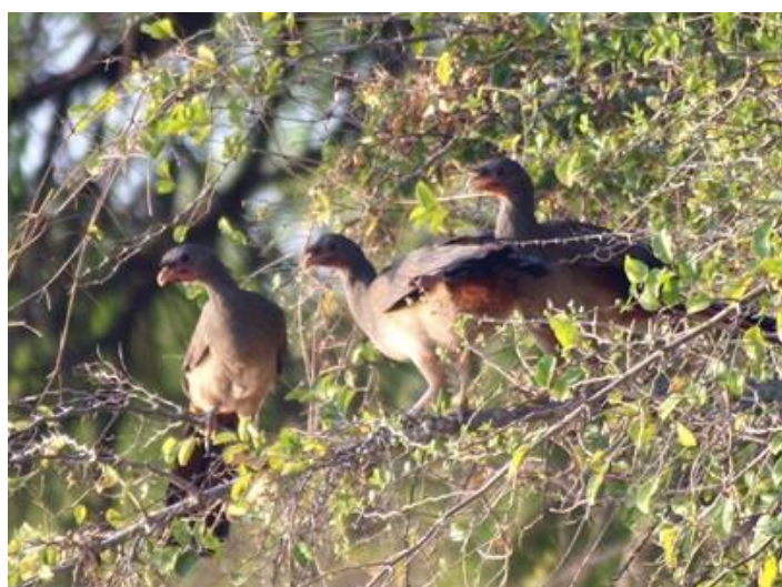
Charata ( Ortalis canicollis ), especie bullanguera, fácil de ver, muy conspicua en la zona, bastante frecuente.