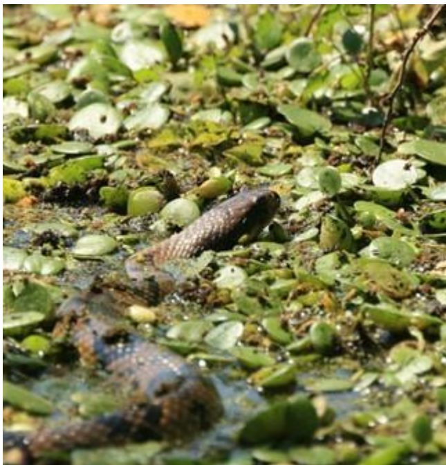
La Ñacaniná de Estero ( Hydrodynastes gigas ), típica de arroyos, lagunas y bañados de la región chaqueña (Foto: Patricio Coper Cowles).