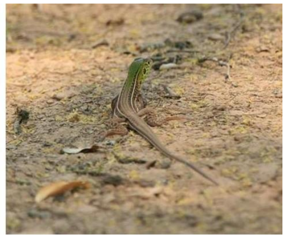
Una lagartija que no pudo ser identificada a nivel especie ( Teius sp.) (Foto: Patricio Cowper Coles).