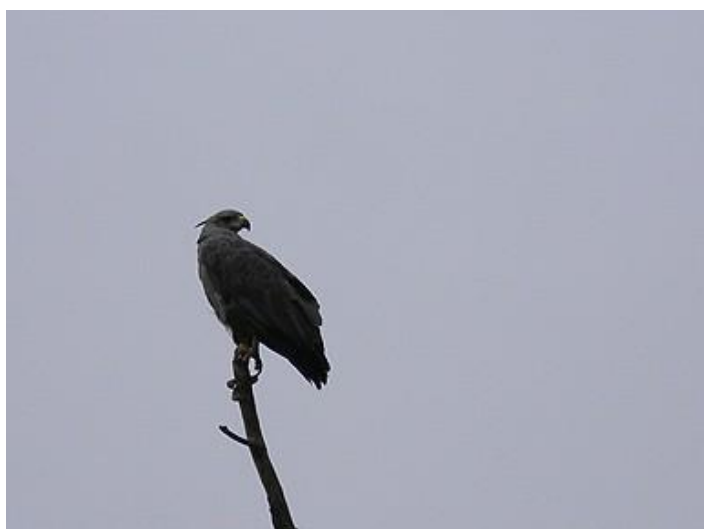
Águila Coronada ( Harpyhaliaetus coronatus ). Este ejemplar adulto fue observado perchedo en un árbol seco durante muchos minutos y luego levantó vuelo alejándose en círculos. Estuvo cantando todo el tiempo.