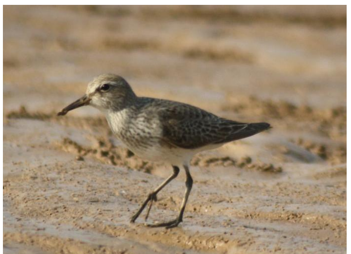
Playerito Rabadilla Blanca ( Calidris fuscicollis ), ave migratoria que habita ambientes acuáticos, se la encuentra en las playas arenosas en pequeñas bandadas buscando alimento en el barro.