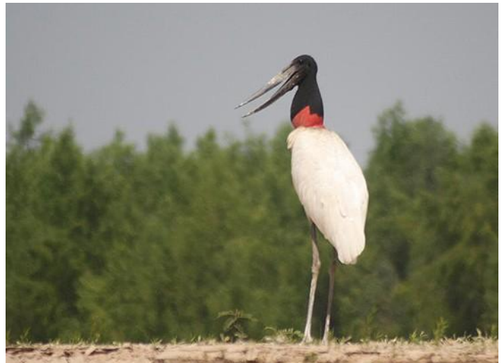
Yabirú o Juan Grande ( Jabiru mycteria ). Ave frecuente en las playas del río Bermejo, por lo general se encuentra en pareja o en pequeños grupos.