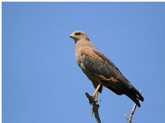
Aguilucho Colorado ( Heterospizias meridionalis ), habitante de praderas, sabanas y montes cercanos al agua (Foto: Patricio Coper Cowles).