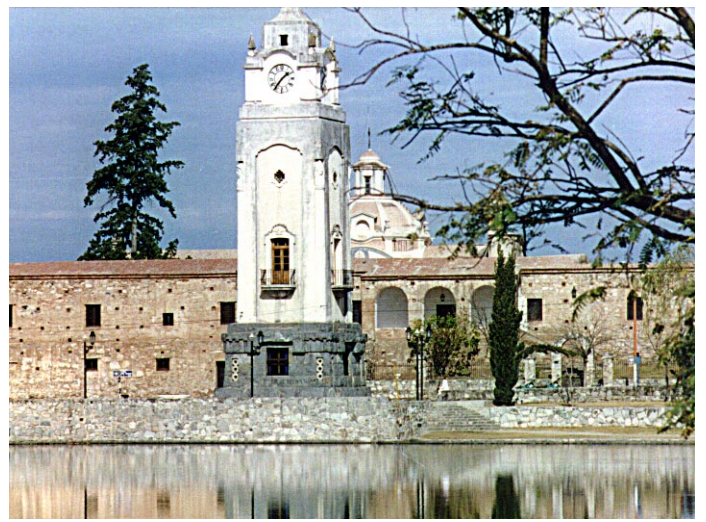
VISTA AEREA Y PANORAMICA, DEL MUSEO HISTORICO NACIONAL "CASA DEL VIRREY LINIERS", DE LA IGLESIA PARROQUIAL DE NUESTRA SEÑORA DE LA MERCED Y EL TAJAMAR DE LA CIUDAD DE ALTA GRACIA.