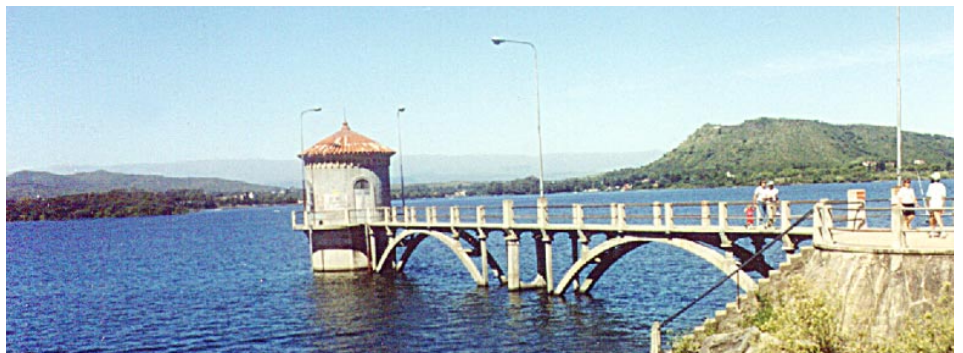
EMBALSE DE RIO TERCERO

grandes posibilidades para el desarrollo de actividades recreativas y deportes acuáticos.