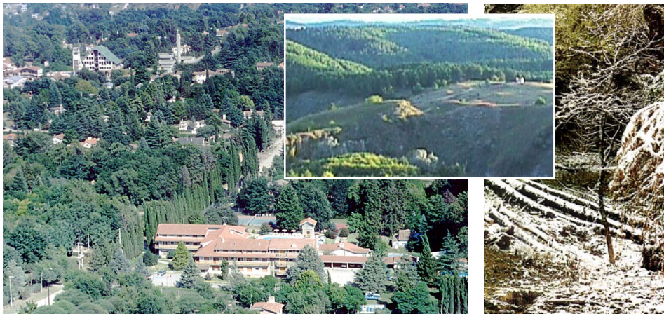
VISTA AEREA DE VILLA GRAL. BELGRANO Y ALGUNOS DETALLES DE LOS ALREDORES DE LA CUMBRECITA, EN EPOCA INVERNAL.