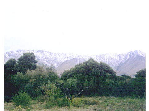
VISTA PARCIAL DE LAS SIERRAS DE COMECHINGONES NEVADAS

PROMOCIONES TURISTICAS VIA DIGITAL. DESCARGAS GRATIS