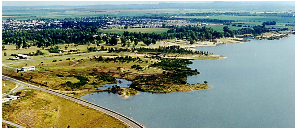
VISTA AEREA DEL DIQUE PIEDRAS MORA