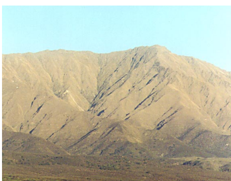
VISTA SERRO CHAMPAQUI 2.790 M. S/N DEL MAR

Nuestra inquietud es dar una primicia de lo bueno por conocer. Usted también puede ser parte de este emprendimiento, publique su aviso en nuestros Promotur Digital. No olvide que acompañar al turista en sus paseos de placer, también es servicio.